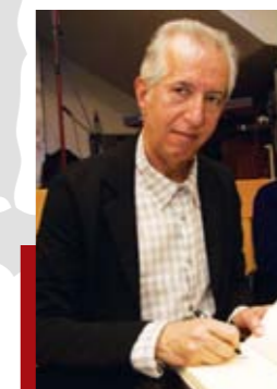
“Ως εκ θαύματος” ήρθε στο Σύνδεσμο... Τελικά δεν είμαστε “Complete Unknown”...