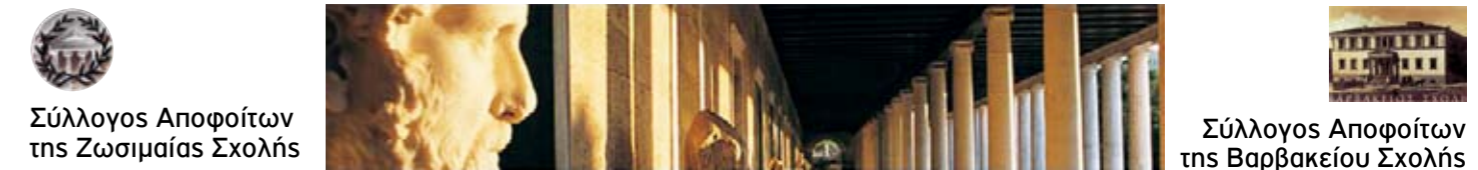
Σύλλογος Αποφοίτων της Ζωσιμαίας Σχολής