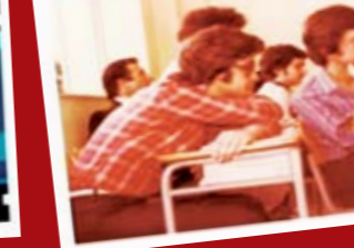
Στ4 - Πρακτικό, Αγγλικά

οι απόφοιτοι του 1977 έχουν group στο facebook με το link: