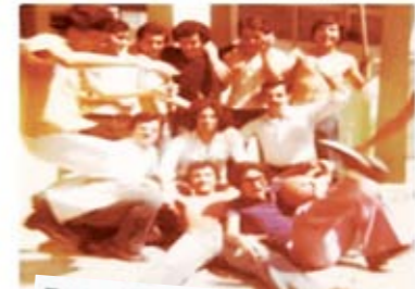
Στ1 - Κλασσικό, Γαλλικά